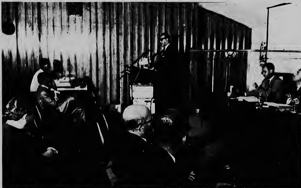
Ayera merdia e congreso pa studia e problematica social y economico na Antillas Neerlandes entre donan di trabao y representantenan laboral, a ser inaugura door di S.E. Minister Kroon. Tabatin gran interes di parti di ambos lado pa e congreso y riba pagina 3 nos lectornan por haña relato extensivo riba e apertura aki.

A filter cigarette that really tastes good... that's Winston! For up front, in the tobacco end, Winston gives you Filter-Blend, an exclusive selection of tobaccos specially processed for the best taste in filter smoking! Smoke America's largest-selling filter cigarette, by far!